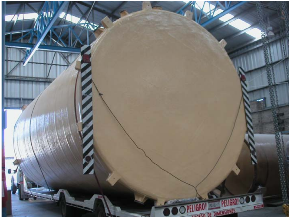
salida de tanque