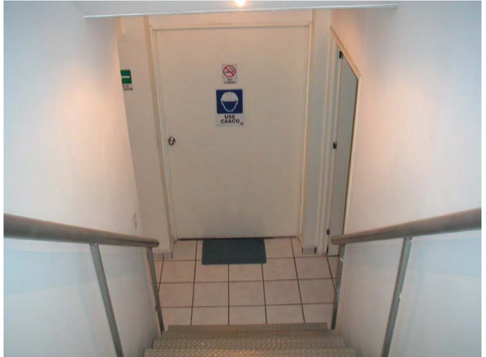
acceso a fábrica