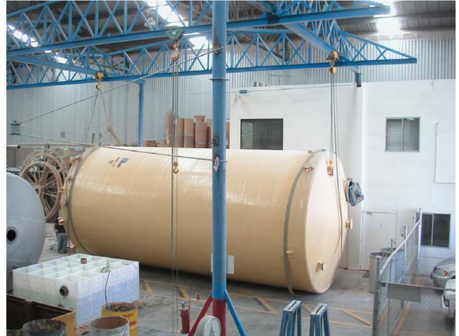
detallado final y preparación para embarque