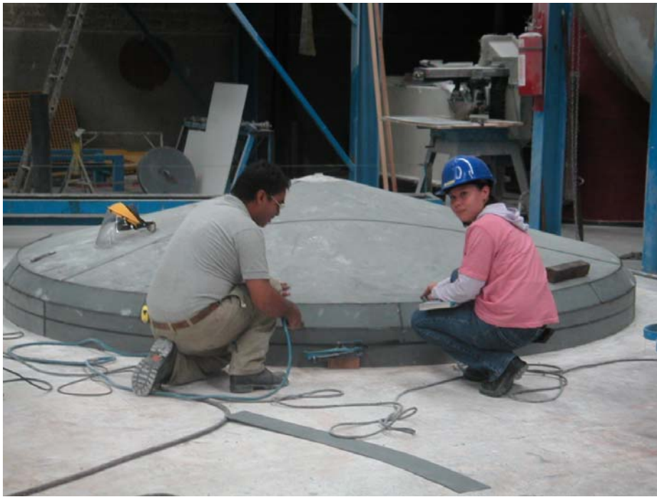
fabricación de fondos y tapas