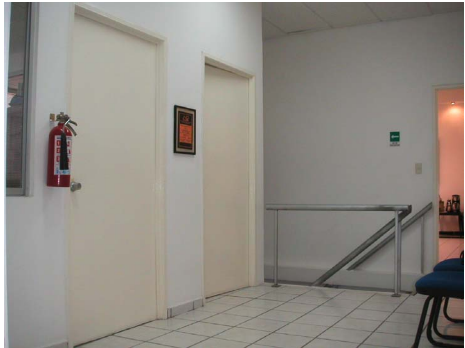
distribuidor de planta alta