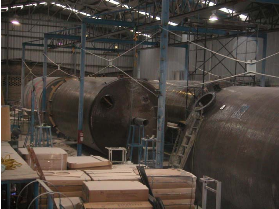
proceso de filamento embobinado