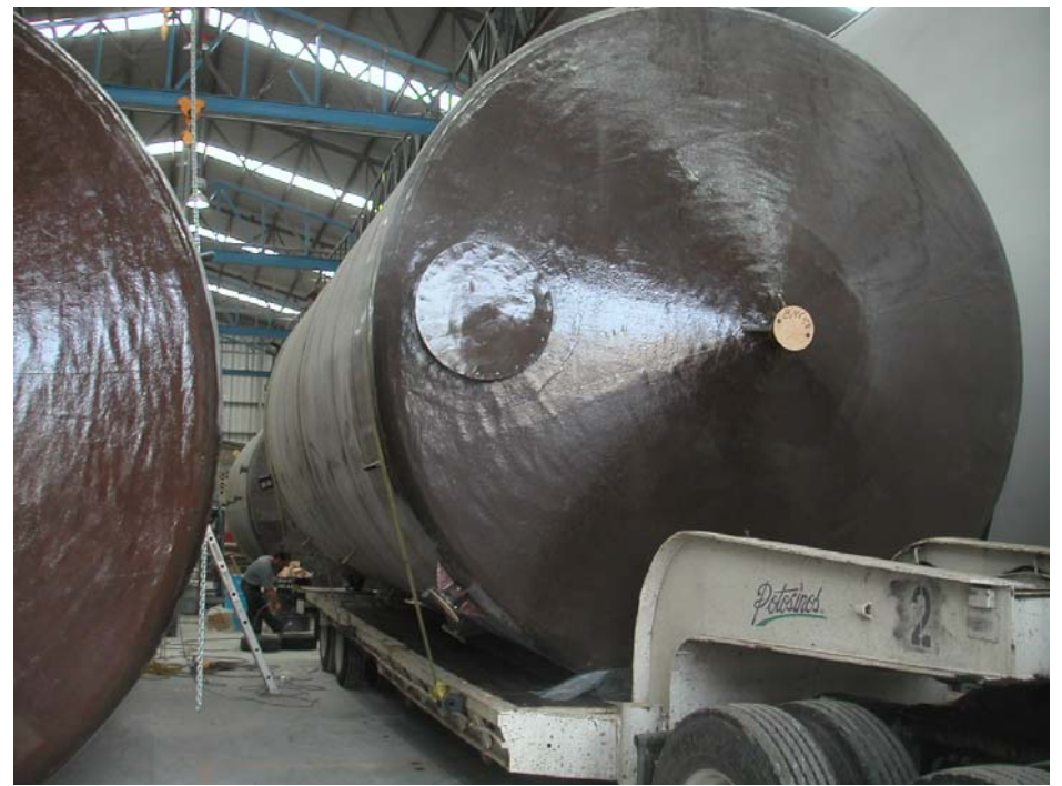
amarre para traslado