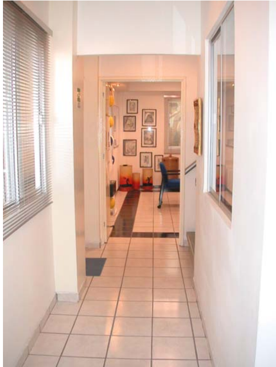
distribuidor planta baja