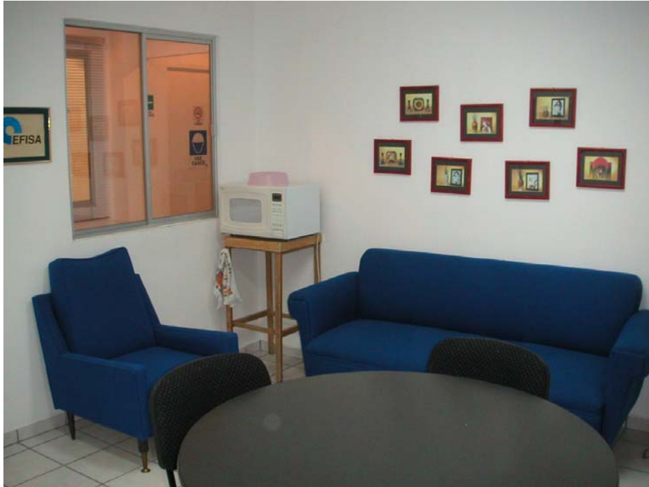
área de descanso