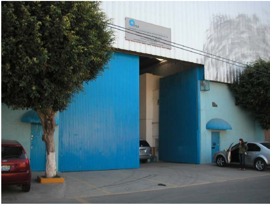
vista exterior de planta