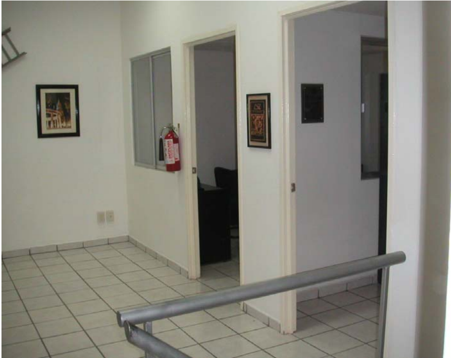
oficinas de ingeniería