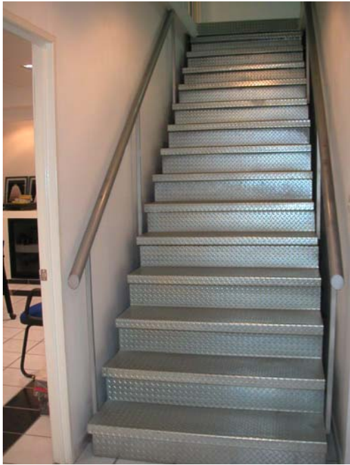
acceso a planta alta