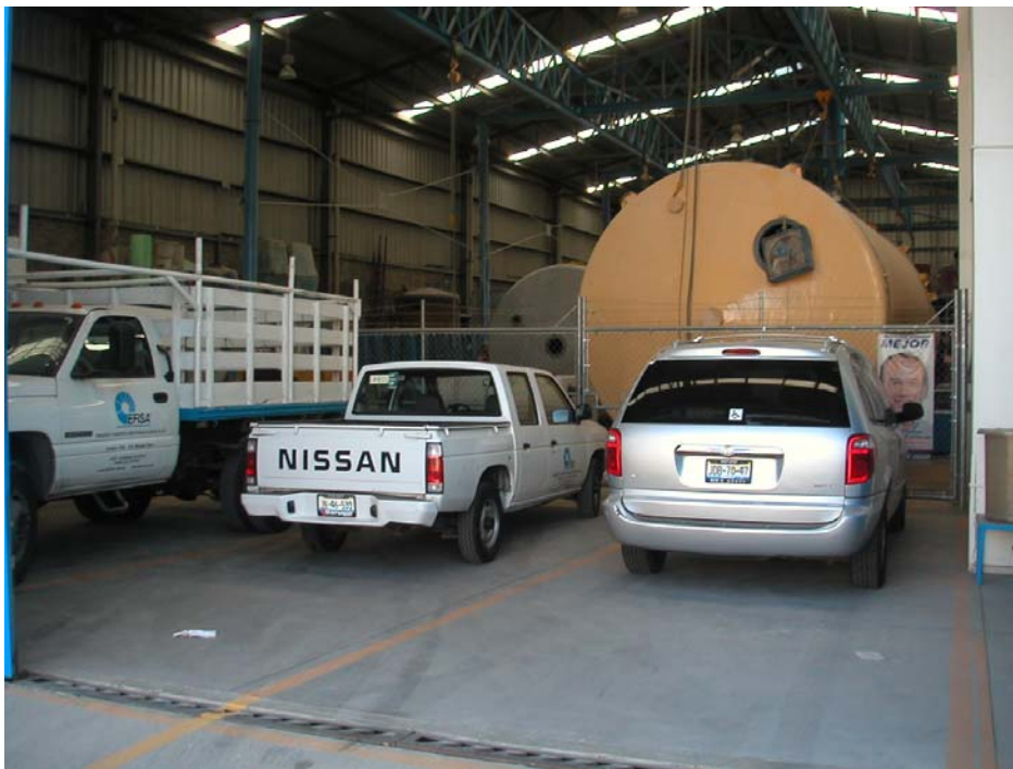
área de carga