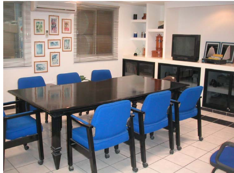
sala de juntas