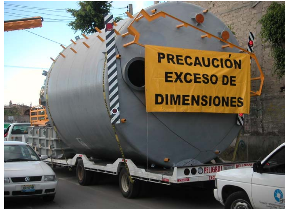
traslado en proceso